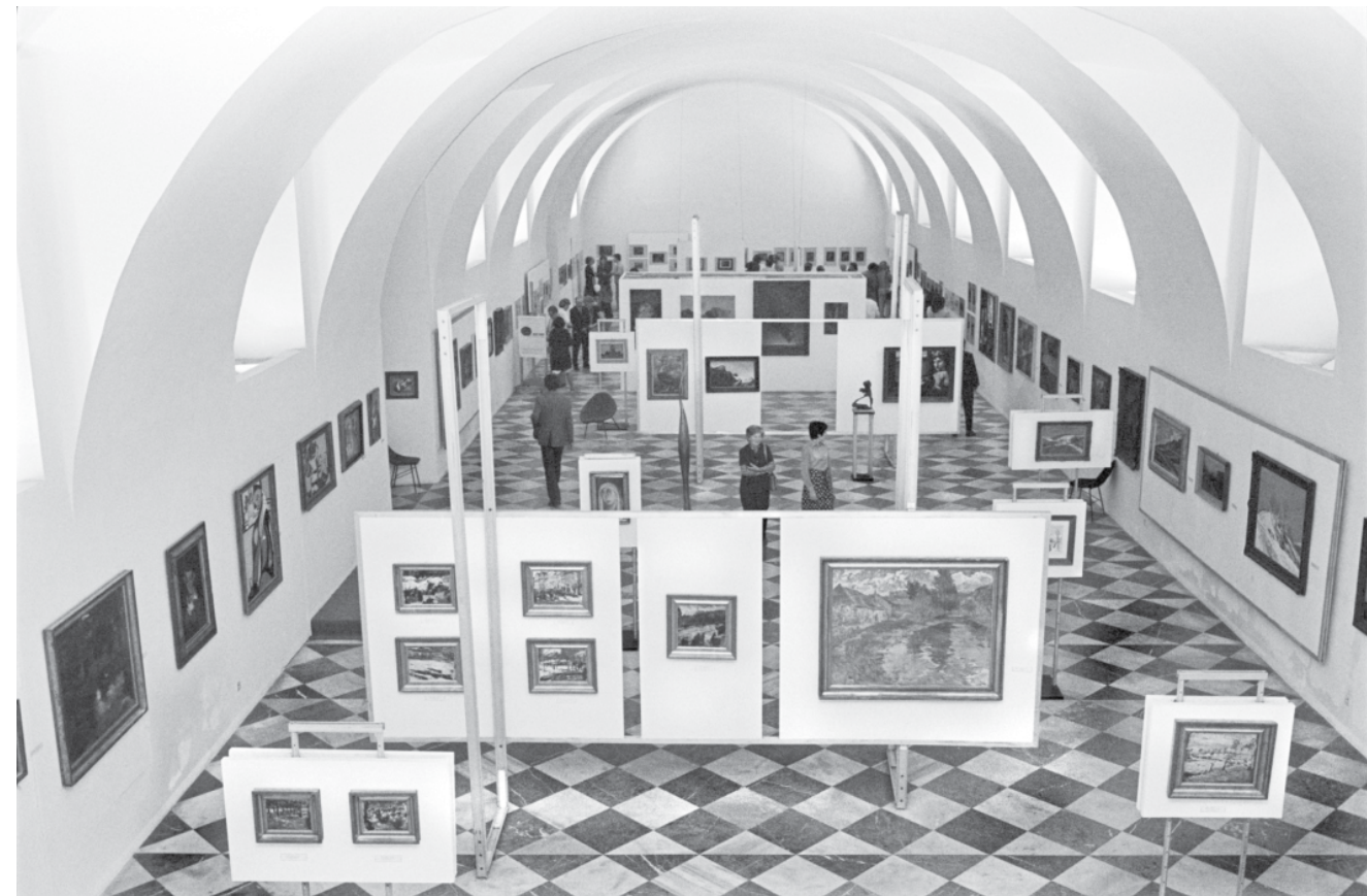
Pohled z balkónu galerie (1976)