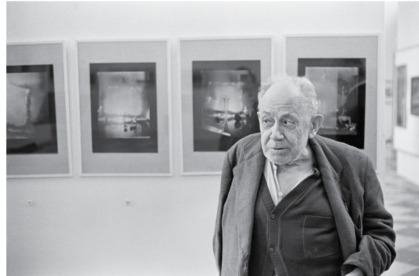
Josef Sudek před vernisáží výstavy svých fotografií v roudnické galerii (1976)

Do Prahy se Charles Sawyer vypravil poprvé v prosinci 1975. Tehdy Sudka navštívil v pražském ateliéru, kde jej zachytil na několika momentkách. Při své druhé cestě o necelý rok později se zúčastnil vernisáže velké výstavy Sudkových