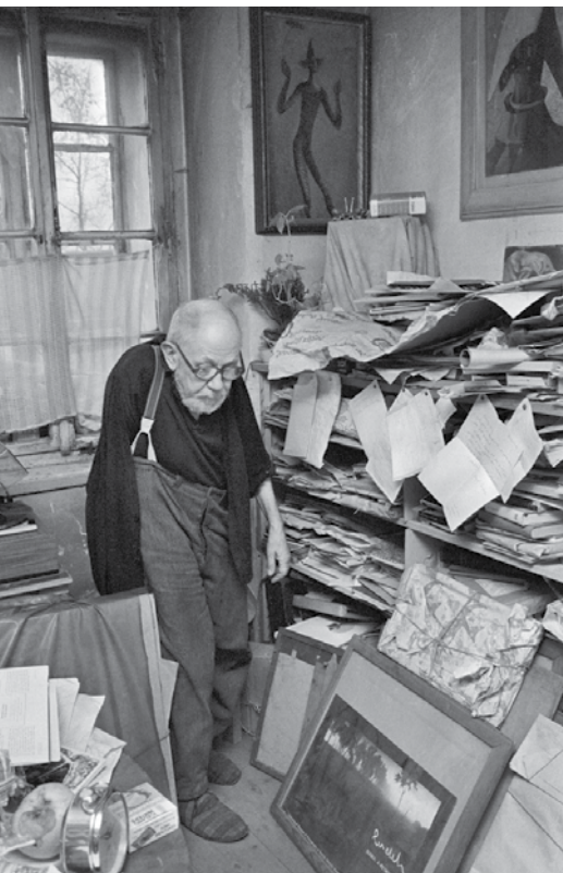
Josef Sudek ve svém ateliéru (1975)