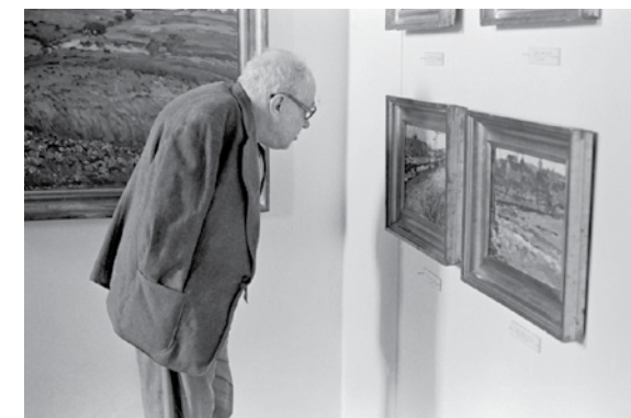
Josef Sudek v roudnické galerii III (1976)