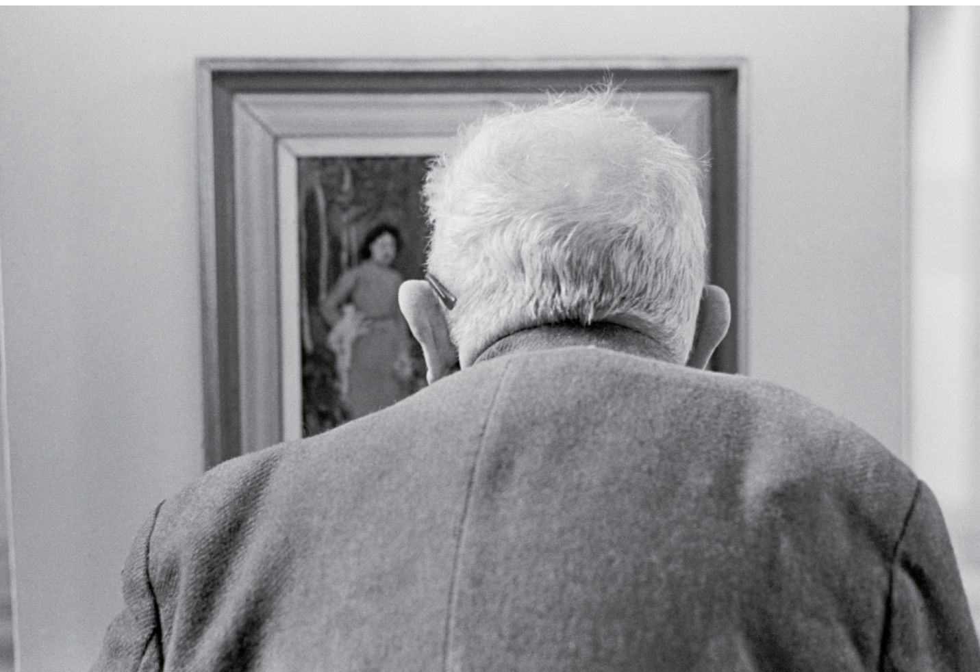
Josef Sudek v roudnické galerii I (1976)