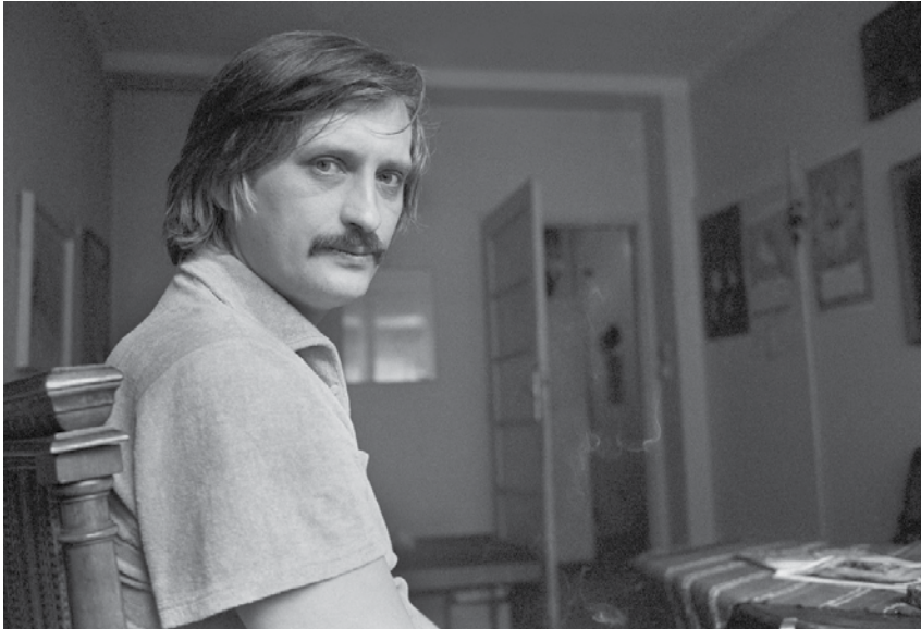
Jiří Dienstbier (1977)