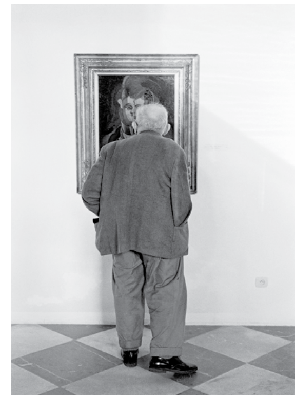
Josef Sudek v roudnické galerii II (1976)