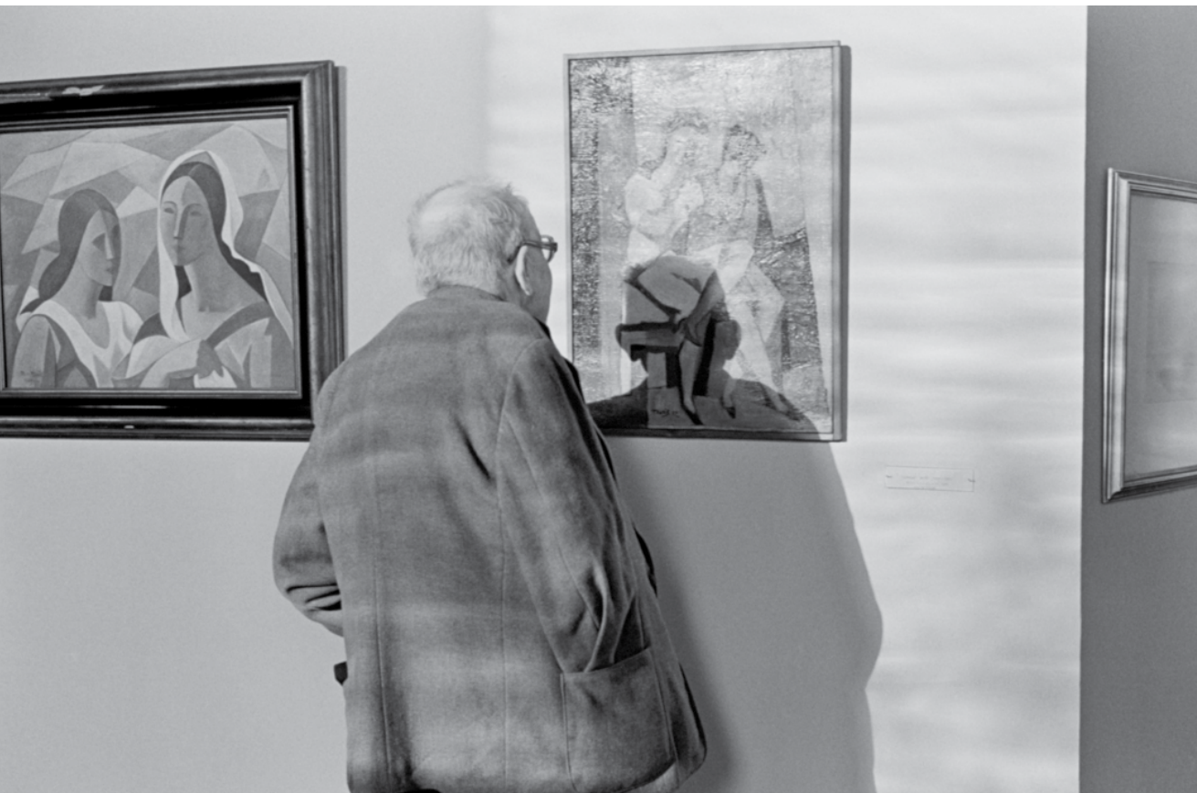
Josef Sudek v roudnické galerii IV (1976)