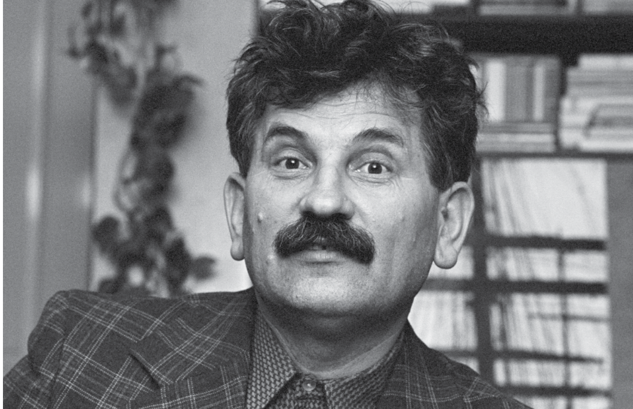
Ludvík Vaculík (1977)