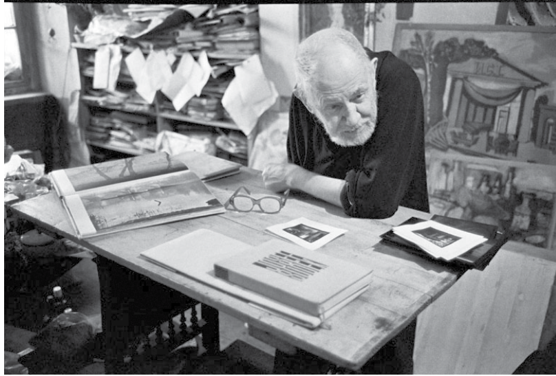
Josef Sudek ve svém ateliéru (1975)